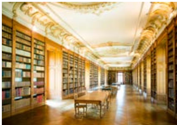
Bibliothèque St Michel