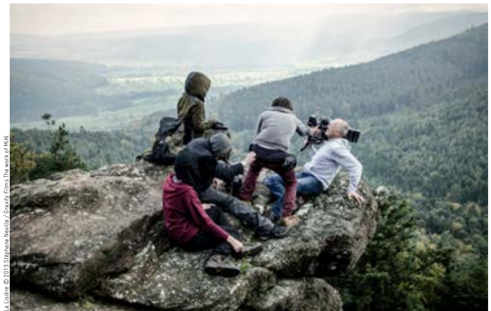
La Lisière The work of MIKI