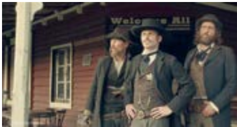
TEMPLETON de Stephen Cafiero Série coproduite par Skits Productions et Telfrance © Skits & Telfrance