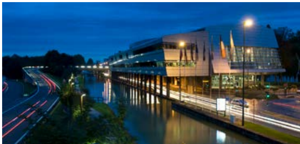
Centre Congrès Reims