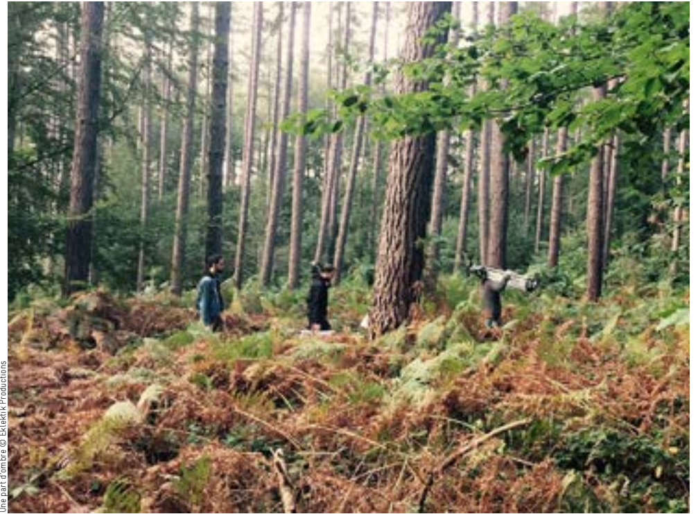
Une part d'ombre