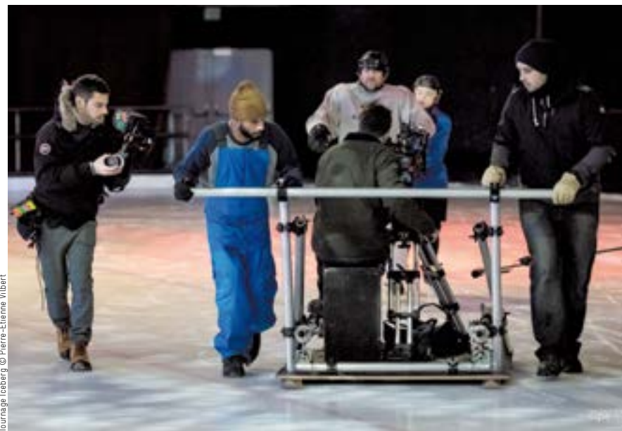
Tournage Iceberg

Ces professionnels travaillent en liens étroits avec un grand nombre de comédiens, directeurs artistiques, auteurs dialoguistes, techniciens expérimentés et des producteurs délégués de fiction.