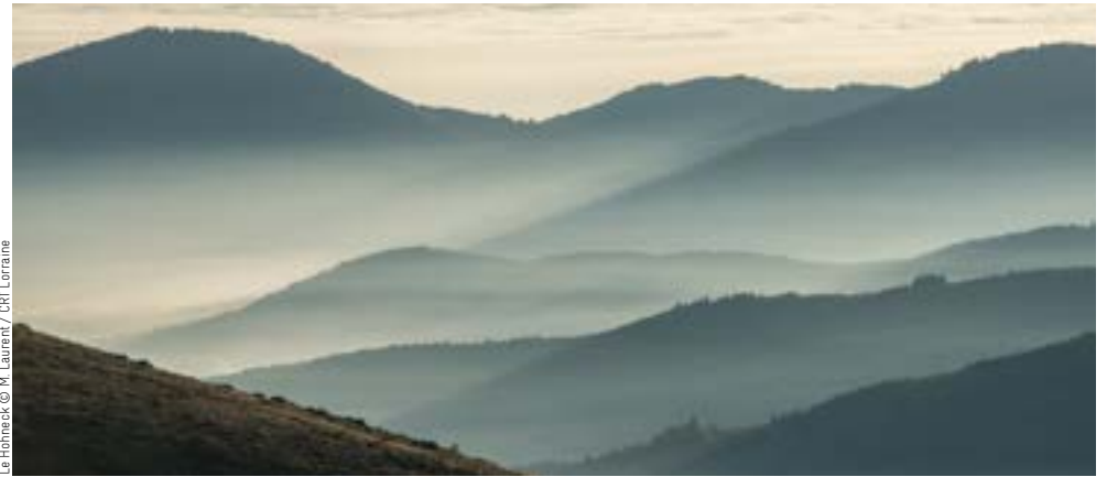
Le Hohneck