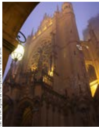
Cathédrale de Metz