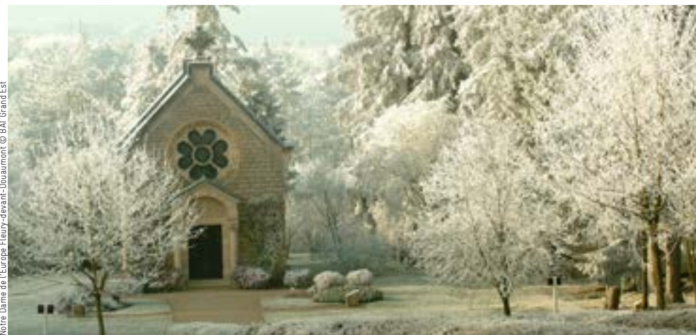
Noire Dame de l'Europe Fleury-devant-Douaumont