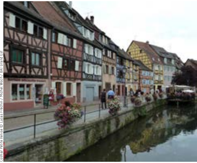
Colmar Petite Venise