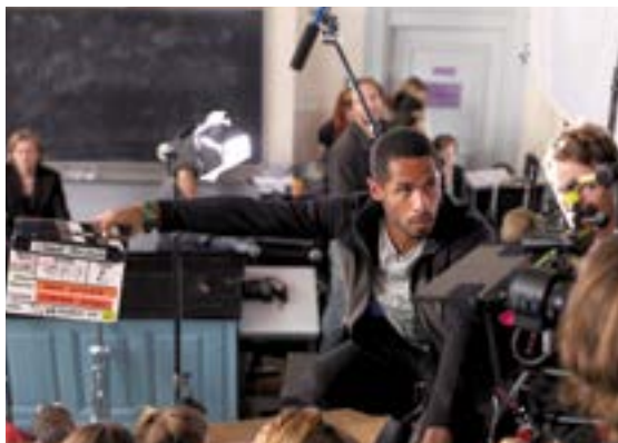
Tournage L'année prochaine