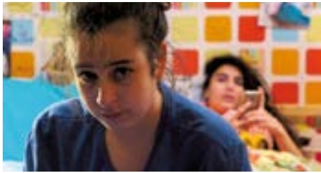
DES BAILS DE RÊVE de Antoine Desrosières Long métrage produit par Les Films de l'autre cougar