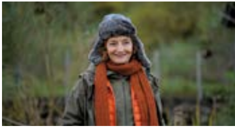
CAPITAINE MARLEAU de Josée Dayan Série coproduite par France 3 et Passion Films (4x90')