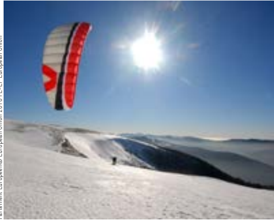
La Bresse