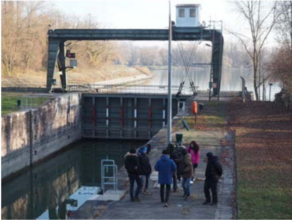
Des baits de rêve