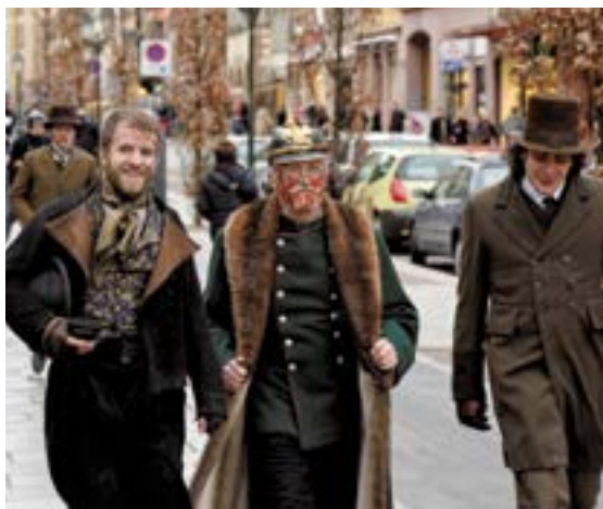
Tournage Sherlock Holmes