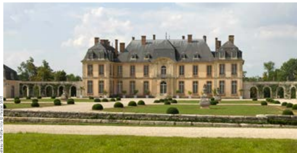
Château la Motte-Tilly