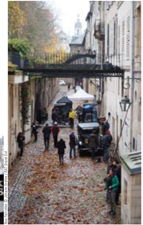
Nos Patrimoines