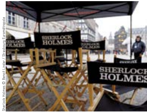
Sherlock Holmes