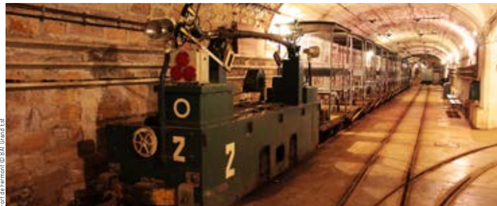
Fort de Fermelet