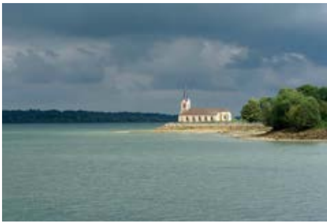
Lac du Der - Eglise de Champaubert