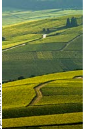
Vignoble Hautwillers