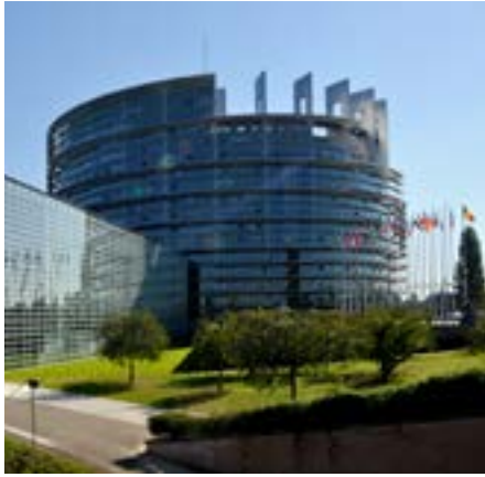
Parlement Européen